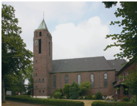
Kath. Kirche St. Marien, Moers